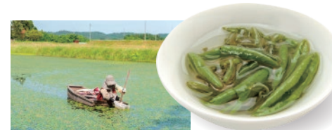
秋田県三種町/ジュンサイ収穫の様子